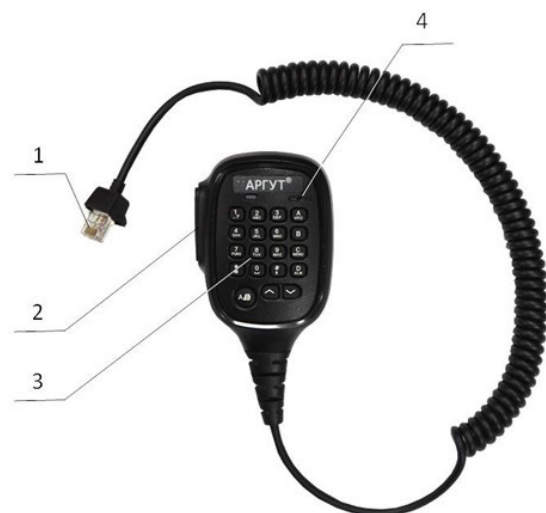
Рис. 3. Расположение органов управления и соединителя гарнитуры